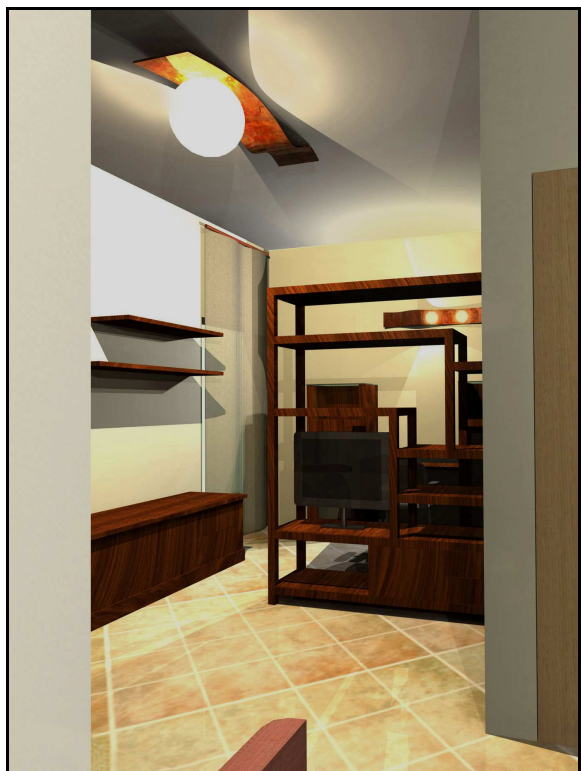
Salottino: simulazione di progetto.