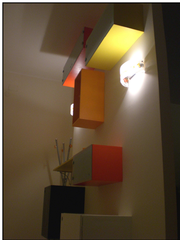
Ingresso: fotografia scattata a fine lavori.